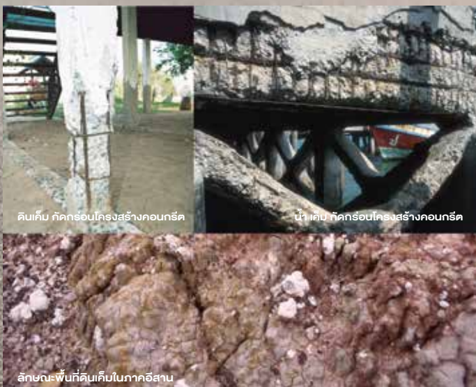
ดินเค็ม กัดกร่อนโครงสร้างคอนกรีต